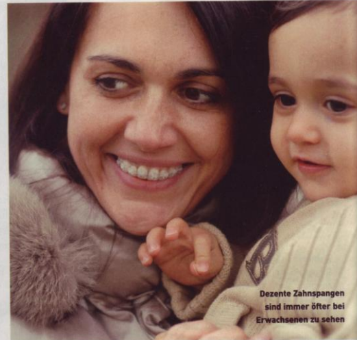
Dezente Zahnspangen sind immer öfter bei Erwachsenen zu sehen

Dabei hält ein Clip den Zahnspangen-Draht im Bracket, Ligaturen – also Gummizüge – sind nicht mehr notwendig. Die gewünschten Zahnbewegungen werden mit kleinen Kräften von etwa 50 g, geringer Friktion und weniger Behandlungsterminen mit kürzeren Intervallen erzielt. Stehen nur leichte Korrekturen der Zahnstellung an, so gibt es mit Invisalign eine Methode, die ohne Brackets auskommt und die de facto unsichtbar ist. Im Gegensatz zu festsitzenden Apparaturen mit Brackets und Drähten kann der Patient die Schiene beim Essen oder bei der Zahnpflege herausnehmen. Nach Abschluss der Therapie muss bei allen Systemen die Zahnkorrektur über einen Zeitraum von etwa einem Jahr mit sogenannten Retainern stabilisiert werden. ←